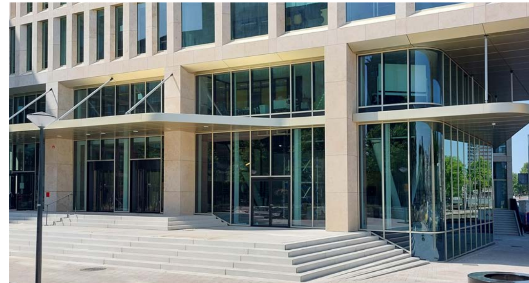
Ook was M.C. Kersten BV verantwoordelijk voor de stalen deuren en ramen op de begane grond en in het vluchttrappenhuis.

'Met dit project bewijzen wij andermaal dat wij geen uitdaging uit de weg gaan'